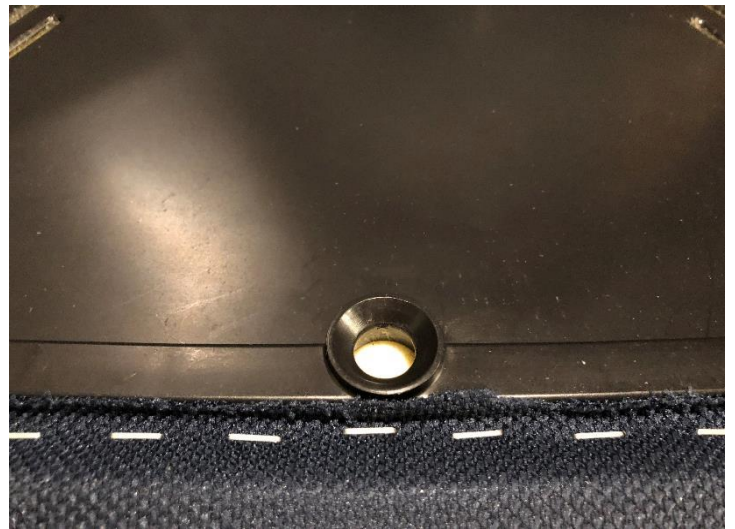
クッション裏面の突起（はめ込む凹部）× 8個